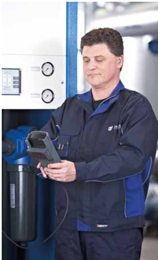
Total Filtration Service pour l'Air Comprimé