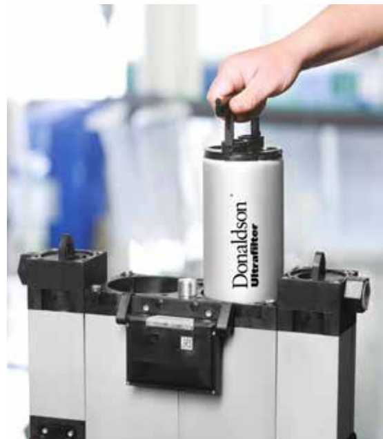
Changement aisé et nettoyage des éléments filtrants