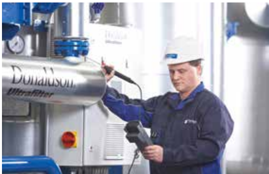
La maintenance préventive évite les appels en urgence

Les technologies de mesures de Donaldson permettent de déterminer la qualité de votre air comprimé. Point de rosée, teneur en huile ou contamination sont analysés. L'audit de qualité d'air détecte et détermine également les teneurs en oxygène, CO 2 et CO pour les applications spécifiques, telles que l'air respirable.