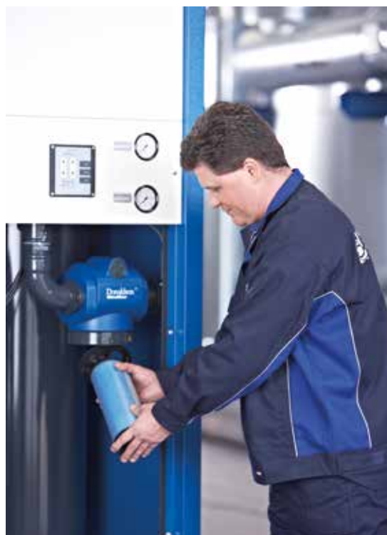
Le corps de filtre Ultra-Filter est facile à ouvrir pour changer l'élément filtrant

Donaldson propose des services pour tous les composants de votre réseau d'air comprimé – la meilleure sélection de prestations, des plus simples au plus complètes. Des contrats de divers niveaux pour répondre à vos demandes et besoins précis.